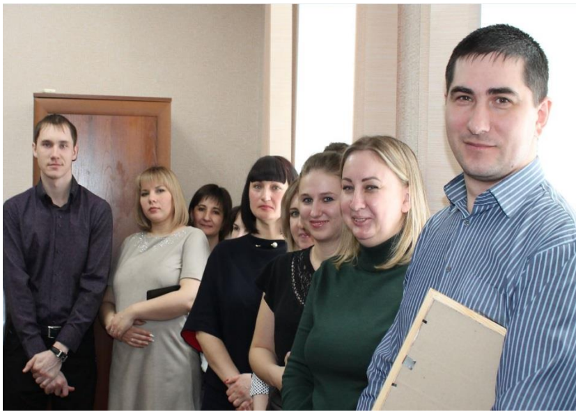
Фонд капремонта в лицах.