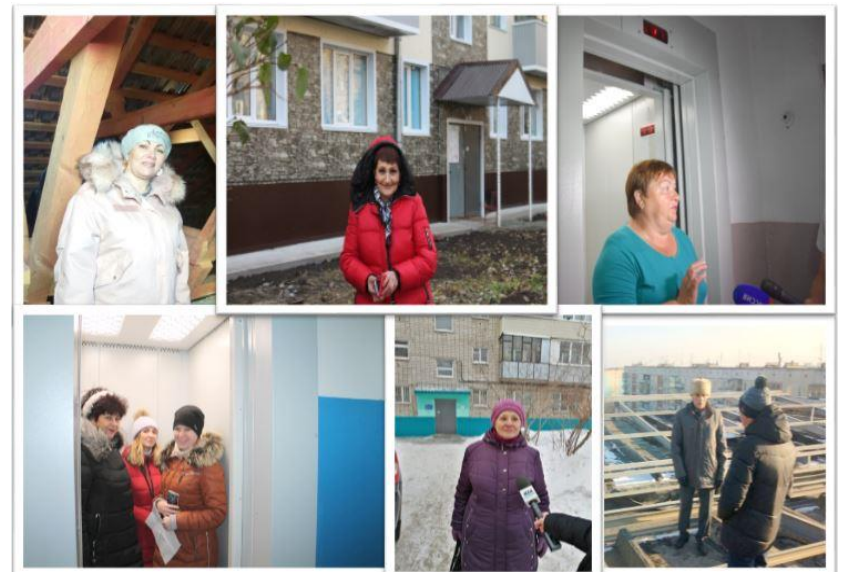
Капремонт – дело общее!