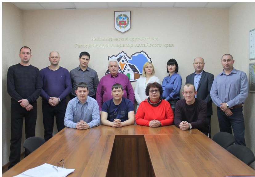
Капитальный ремонт под контролем.