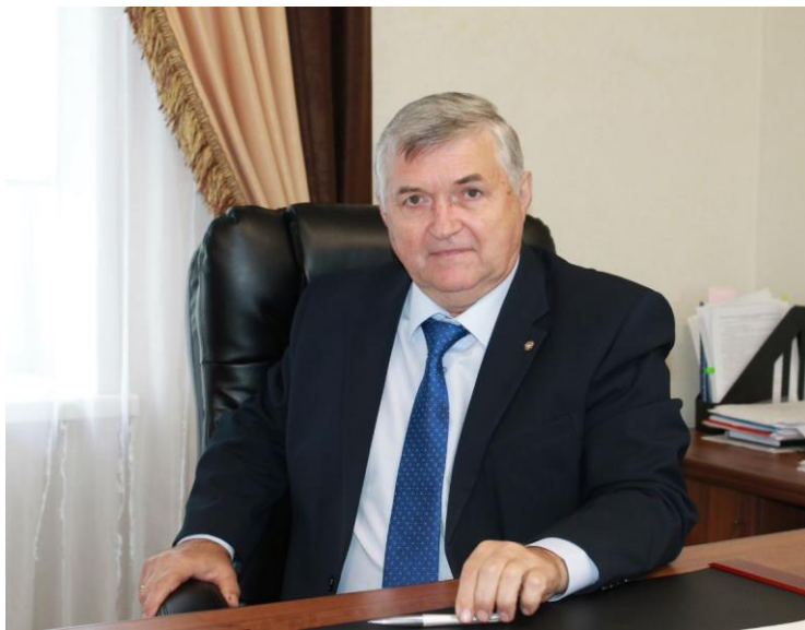
Капитальные итоги: Фонду капремонта Алтайского края 5 лет. Интервью с генеральным директором Фонда.